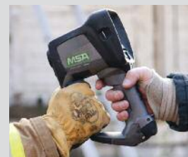
Modèle à deux poignées breveté