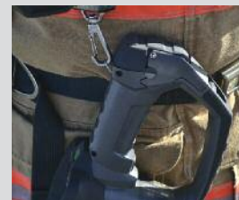
3 points de fixation pour mousqueton