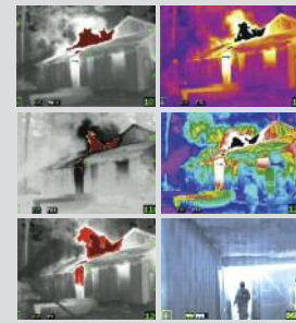
Six palettes de couleurs