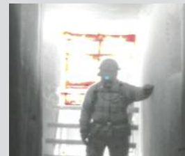
Image de base en couleur