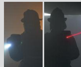
Lampe de poche/ pointeur laser