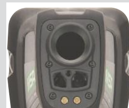
Lentille germanium remplaçable sur le terrain